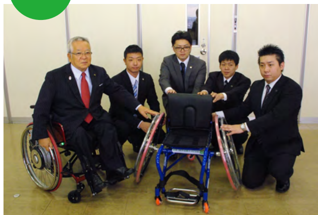
2014年11月28日、一般社団法人岐阜県障害者スポーツ協会様へ車いすを寄贈いたしました。