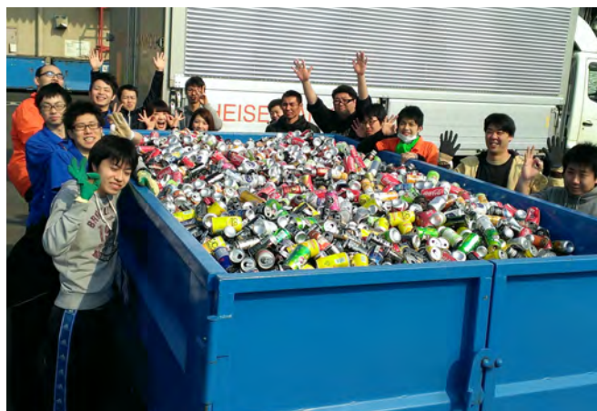
アルミ缶・ペットボトルキャップの回収、リサイクル場への搬入まで全てeco 友で行います。